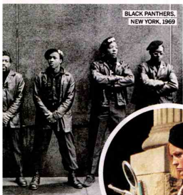
BLACK PANTHERS, NEW YORK, 1969