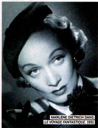
MARLENE DIETRICH DANS LE VOYAGE FANTASTIQUE, 1951