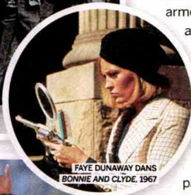
FAYE DUNAWAY DANS BONNIE AND CLYDE, 1967