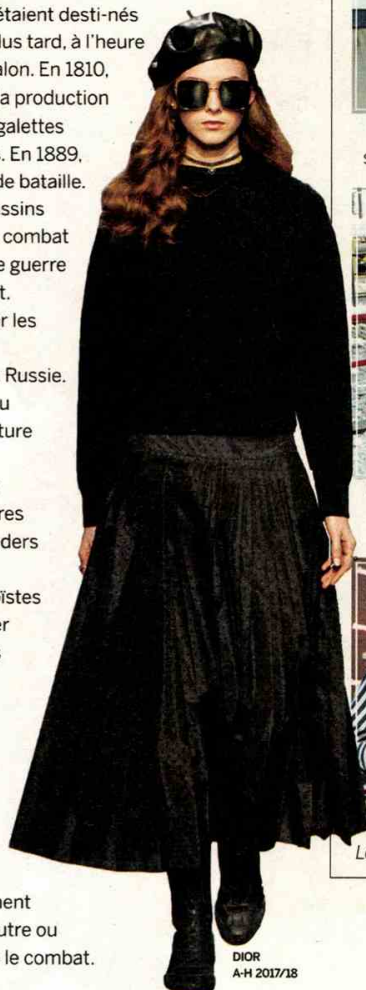
DIOR A-H 2017/18